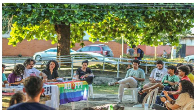
Aula pública CCN