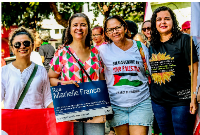
8 de março de 2024 - Ato na Praça do Fripisa

A Associação dos Docentes da Universidade Federal do Piauí (ADUFPI) esteve presente nas ruas no dia 8 de março, unindo suas forças às vozes de todas as mulheres que participaram do ato público unificado em alusão ao Dia Internacional das Mulheres.