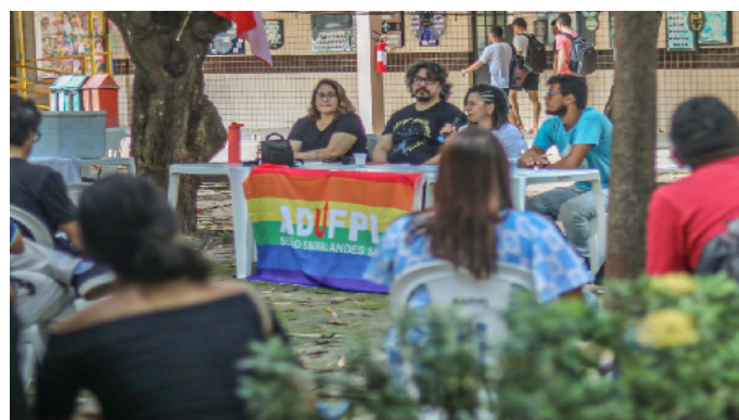
Aula pública CCE/CCHL

As aulas públicas foram realizadas de modo a intensificar a construção da greve docente na Universidade Federal do Piauí, sendo estas, encaminhamentos aprovados em assembleia geral. A diretoria se empenhou em contemplar diversos centros de ensino da UFPI e teve a participação da diretoria, do movimento estudantil e também de técnicos-administrativos. As aulas ocorreram no Centro de Ciências da Educação (CCE), no Centro de Ciências Humanas e Letras (CCHL) e também no Centro de Ciências da Natureza (CCN). Essas atividades foram fundamentais para dialogar com a comunidade acadêmica da UFPI,